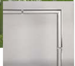
verschweißte Ecken bei Kreuzecken und am Bodenrahmen