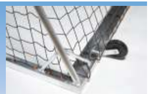
Eckausführung mit Bodenrohr