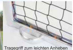
Tragegriff zum leichten Anheben